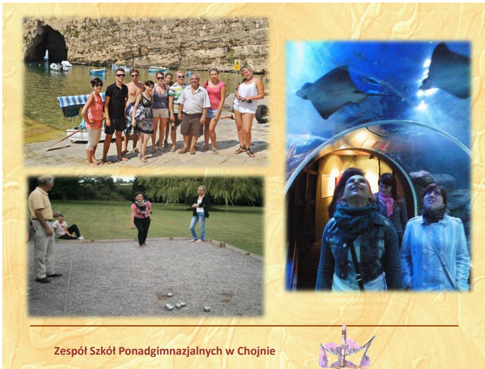
Zespół Szkół Ponadgimnazjalnych w Chojnie