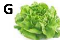
zöldségek, bab, lazac