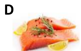
tonhal, lazac, diófélék