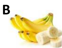
banán, vörös hús, tojás