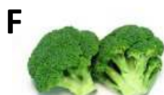
brokkoli, kelbimbó, káposzta