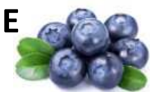
áfonya, lazac, zöld tea