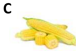
kukorica, tojás sárga, sárgarépa