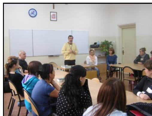
Projekt „Staże Hotelarzy”