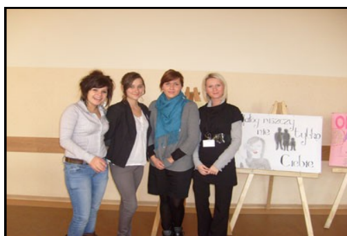
Konkurs wiedzy o HIV i AIDS