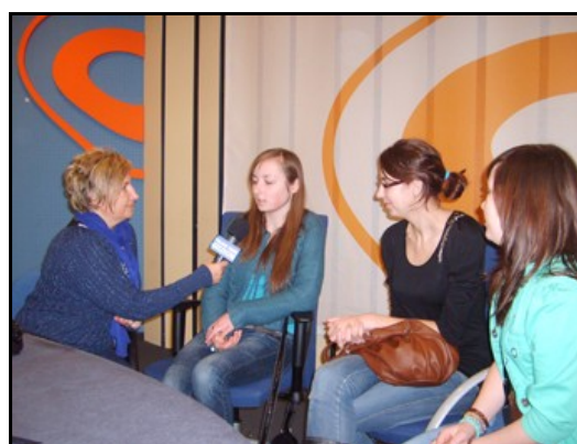
Wizyta w Polskim Radiu Szczecin