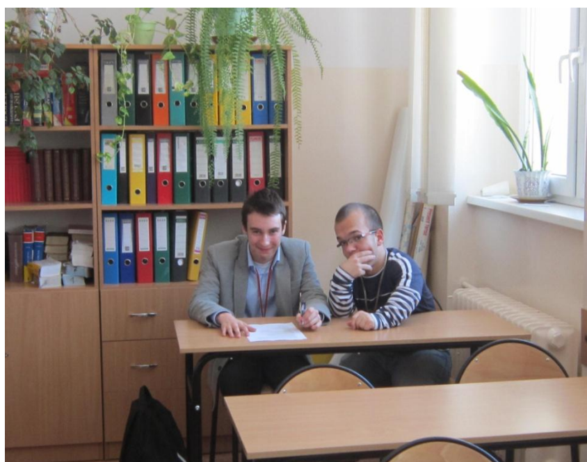
Konkurs wiedzy o krajach niemieckiego obszaru językowego.