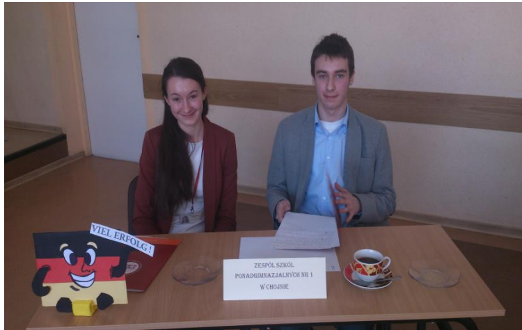
Konkurs „Gdyby nie DER, DIE, DAS...“